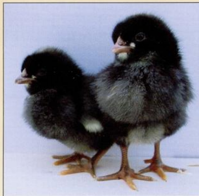
Eendagskuikens van het Aarschots hoen.

Door kruisingen met de bestaande (kleinere) lokale hoenders is dan na verloop van tijd een hoen ontstaan dat qua grootte vermoedelijk tussen de beide ouders in stond maar dat superieur (ten opzichte