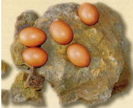
Eieren van het Aarschotse hoen moeten ongeveer de kleur hebben van de roestkleurige Hagelandse ijzerzandsteen.