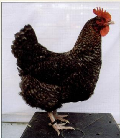
0-1 Aarschots hoen.

Door de relatief arme landbouwgronden en gebrek aan industrie werd de bevolking min of meer gedwongen om ver van huis te gaan werken om het gezin te onderhouden. Velen gingen de dagelijkse boterham verdienen in de grootsteden Brussel en Antwerpen waar men de lichaamskracht van deze geharde buitenmensen goed kon gebruiken.