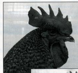
Kopstudie van een haan.

Oorspronkelijk dacht Jac. Cyfers de klus te kunnen klaren in vier jaar. Pas in 2003 was het zover dat het Aarschots Hoen officieel erkend werd. Vooral in de beginfase heeft men elk kweekseizoen weer moeten vaststellen dat nog een zeer groot gedeelte van de gekweekte kippen zich als rasonzuivere exemplaren uit de eischaal pikten. Door strenge selectie probeerde men stap voor stap tot het uiteindelijke kweekdoel te komen. Al deze problemen probeerde men te ondervangen door met een bredere basis aan lijnenteelt te doen wat in de toekomst toelaat mogelijke problemen als gevolg van inteelt te ondervangen.