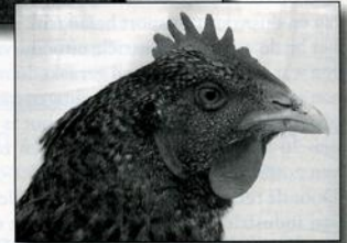
Kopstudie van een hen.