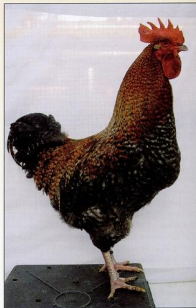
1-0 Aarschots hoen.

Men wist nu hoe het Aarschots Hoen er van buiten uit moest zien. Maar over de innerlijke eigenschap-